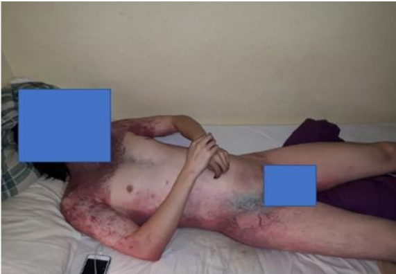
Ilustración 3 Livideces cadavéricas