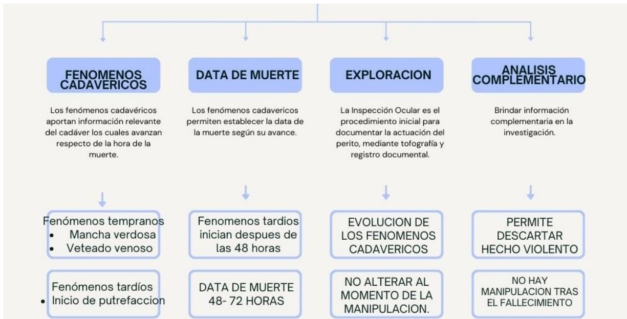
Ilustración 4 Análisis del fenómeno cadavérico con livideces

Respuesta 1.- La victima presenta los siguientes fenómenos cadavéricos: livideces cadavéricas que son fenómenos que aparecen de forma temprana y presenta mancha verdosa en la fosa iliaca derecha, veteado venoso en los muslos, ampollas o flictenas en los miembros superiores, fenómenos tardíos que se presentan en el inicio de la fase inicial de la putrefacción.