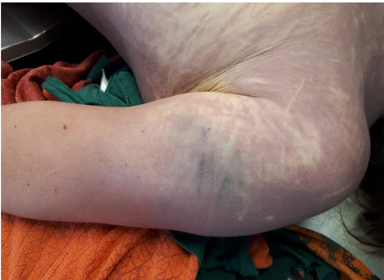
Ilustración 14 Lesión localizada en la cara externa del brazo izquierdo

No obstante, su presencia puede aportar información relevante para la reconstrucción de la dinámica de los hechos, especialmente si se correlaciona con otras lesiones más graves encontradas en el cadáver.