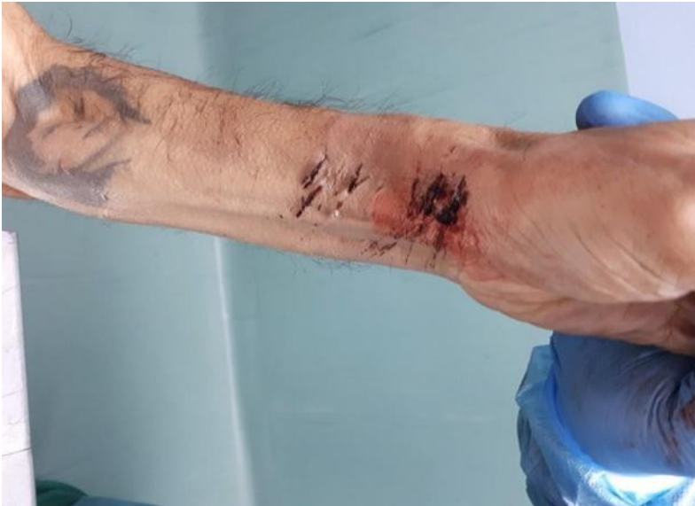
Ilustración 15 Herida en la muñeca izquierda