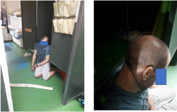
Ilustración 16 Muerte por asfixia mecánica