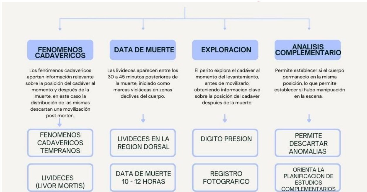
Ilustración 2 Análisis del Fenómeno cadavérico

Respuesta 1.- En la imagen se observa un cadáver femenino que presenta livideces cadavéricas (livor mortis), las cuales corresponden a fenómenos cadavéricos tempranos o recientes, de naturaleza abiótica.