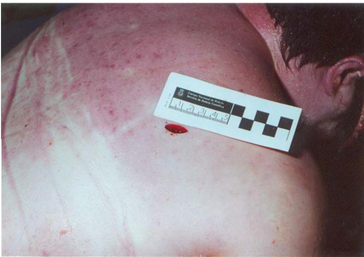
Ilustración 12 Herida en el tronco posterior

La lesión observada corresponde a una laceración contusa craneal, producida en vida por un objeto romo, potencialmente mortal y compatible con una muerte violenta de etiología homicida, pendiente de correlación con el estudio interno y los hallazgos autópsicos complementarios.