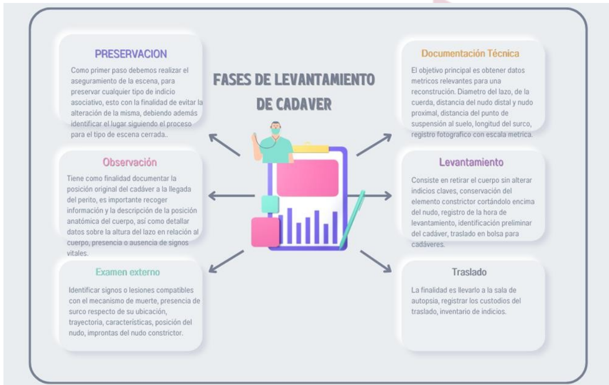
Ilustración 17 Fases de levantamiento cadavérico

Para realizar el levantamiento del cadáver de acuerdo a las ilustraciones graficas en el presente caso, objeto de estudio es importante establecer una metodología técnica que nos permita seguir un proceso adecuado en la Inspección Ocular Técnica, con la finalidad de poder recabar la mayor cantidad de elementos relacionados al hecho, que se constituirían como indicios, que luego de las etapas del proceso penal podrían ser valoradas como pruebas.