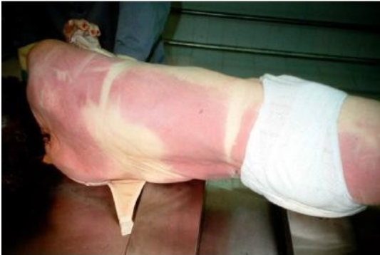
Ilustración 1 Fenómeno Cadavérico