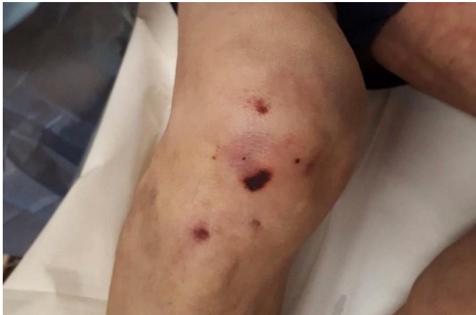
Ilustración 13 Lesión en la rodilla

La lesión observada corresponde a una herida inciso-punzante, producida en vida por un arma blanca, compatible con una muerte violenta de etiología homicida, cuya relevancia causal deberá confirmarse mediante el estudio del trayecto lesional y el examen interno durante la autopsia. La localización dorsal es atípica para lesiones autoinfligidas lo que sugieren intervención de un tercero.