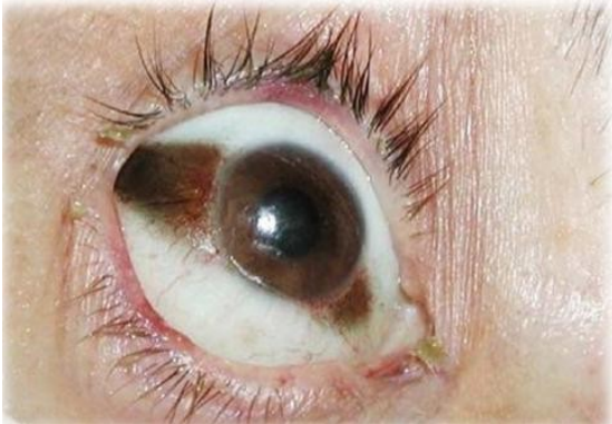
Ilustración 9 Fenómeno cadavérico con decoloración marrón o negruzca