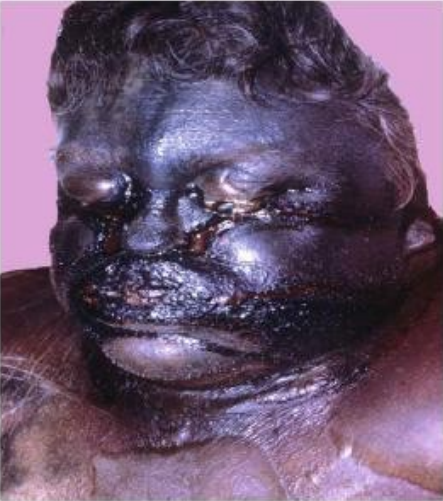
Ilustración 5 Fenómeno cadavérico tardío