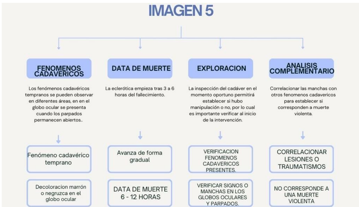
Ilustración 10 Análisis del fenómeno cadavérico con decoloración marrón o negruzca

Respuesta 1.- El fenómeno cadavérico presente, en esta imagen se produce de manera temprana en la muerte, es una de las primeras características en aparecer, consiste en una decoloración marrón o negruzca que aparece en la esclerótica, como consecuencia de la desecación del globo ocular post mortem, cuando los párpados han permanecido abiertos o entre abiertos.