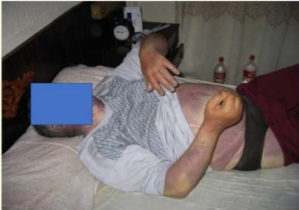
Ilustración 7 Fenómenos cadavérico temprano

debiéndose considerar que es fundamental hacer una correcta apreciación para reconocer si los traumatismos pudieran haber sido provocados por una asfixia mecánica.