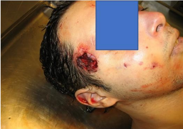
Ilustración 11 Lesión de disparo