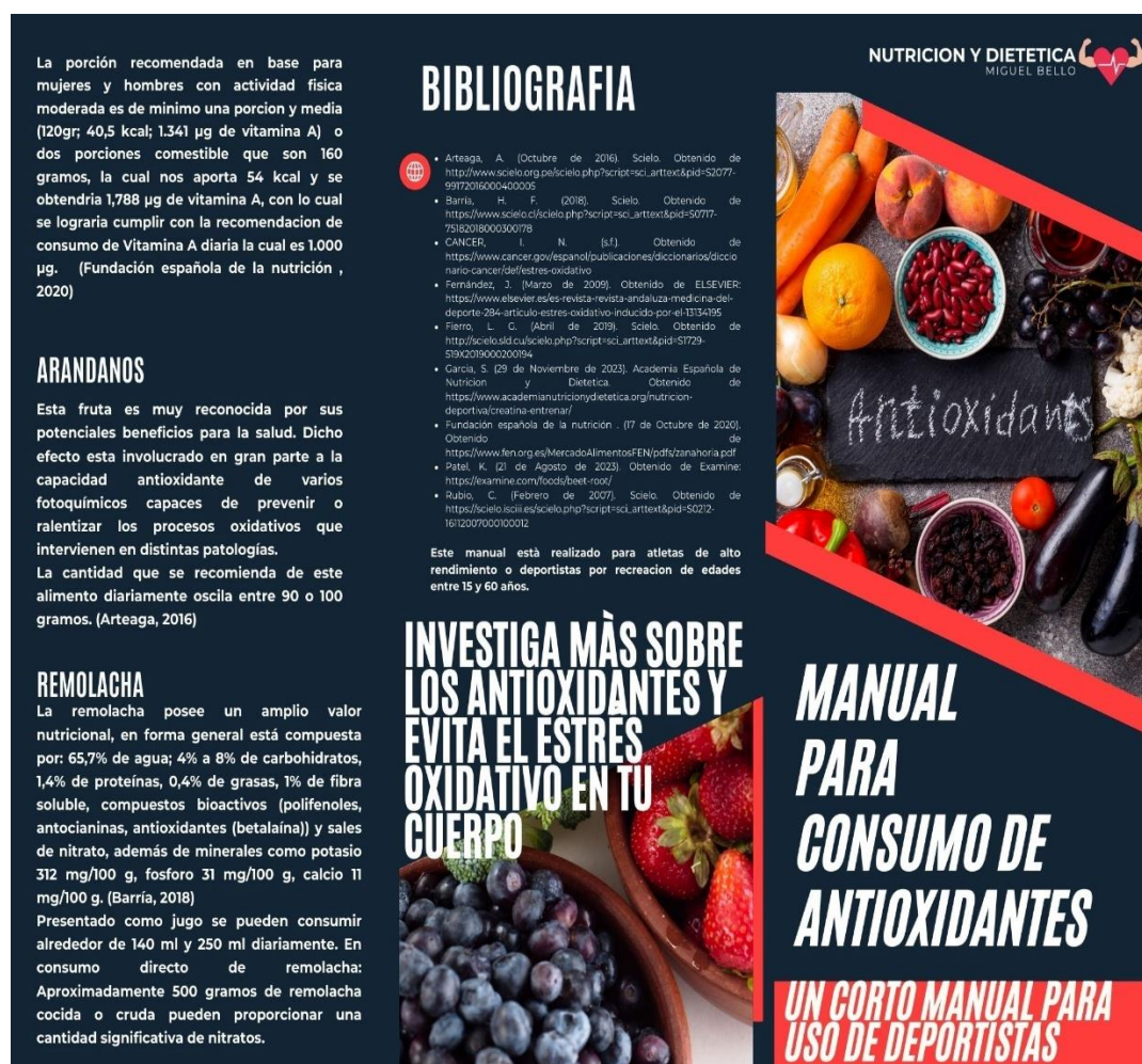
Figura 2. Manual para el consumo de antioxidantes (parte frontal)

Nota. Elaboración propia basada en Arteaga (2016).