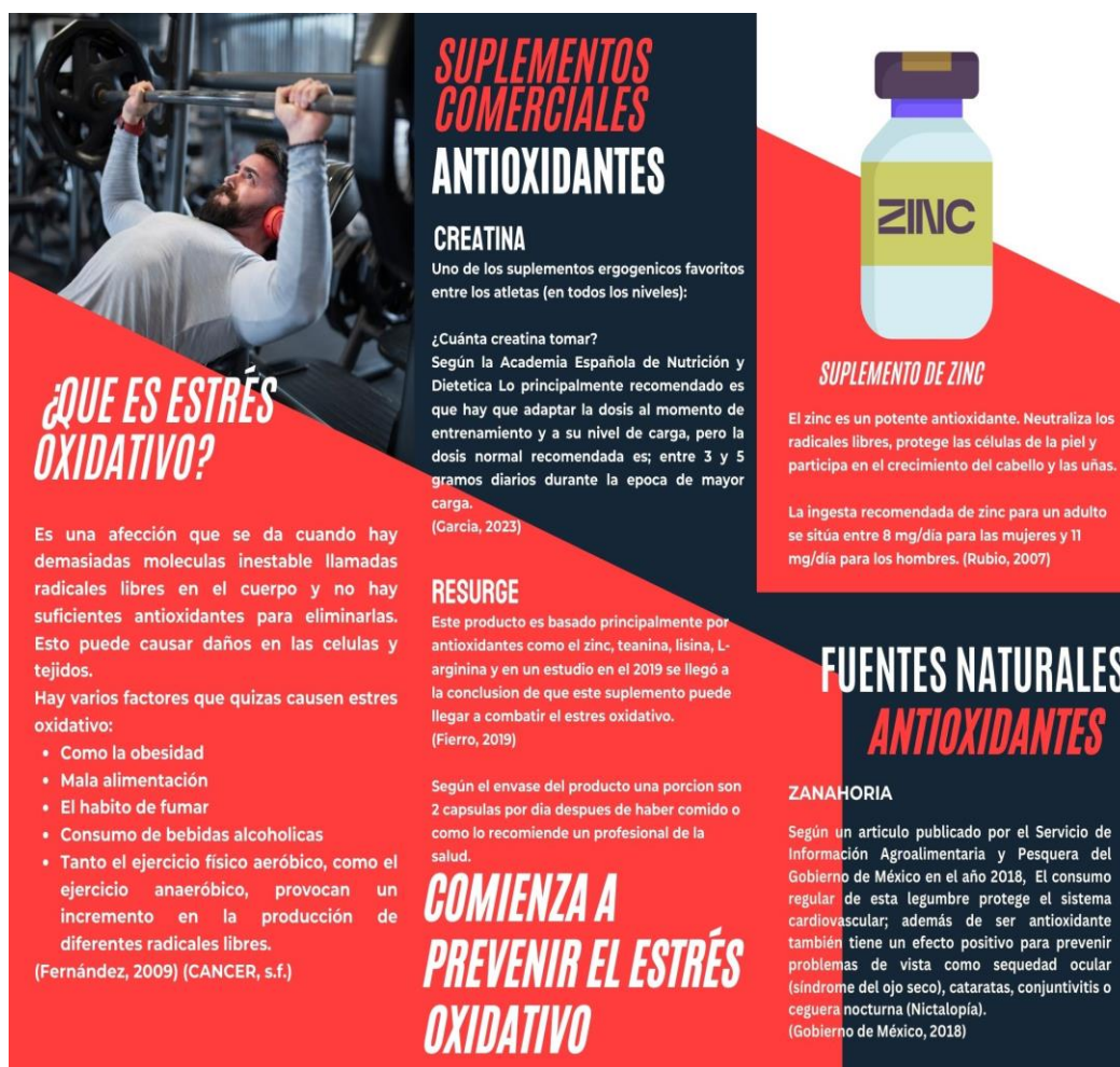
Figura 3. Manual para el consumo de antioxidantes (parte posterior)

Nota. Elaboración propia basada en Arteaga (2016).