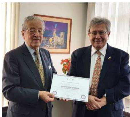
Embajador José Ayala Lasso, director de la Escuela de Diplomacia y Relaciones Internacionales