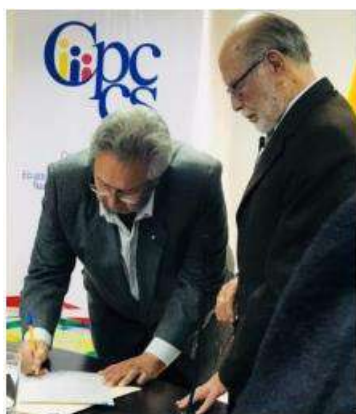
Firma de aceptación como Consejero del CNE transitorio.

Trabajaré a pasos acelerados, con eficiencia y responsabilidad para abrir la brecha del cambio necesario en la Función Electoral. Tengo la confianza de que, si bien no podremos abarcar el amplio espectro de lo complejo que es el sistema electoral, podremos dar la partitura del libreto para que este país vuelva a tener confianza en las elecciones.