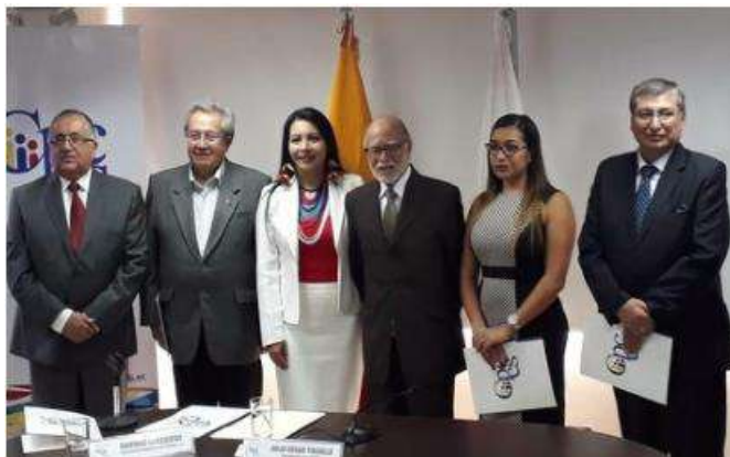
Integrantes del CNE Transitorio y el presidente del CPCCS transitorio, Dr. Julio César Trujillo.