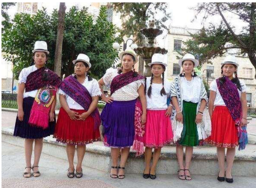
(Paute A. d., 2014)

El atuendo también incluye una blusa blanca de tela fina con un escote de fantasía, y en la espalda se lleva un paño con el escudo de nuestra bandera bordado. El sombrero de paja toquilla, de copa media y media falda, se convierte en un accesorio ideal para protegerse del sol y permite que su portadora luzca aún más elegante. Los sombreros se comercializan en su color natural, y los pauteños utilizan la paja toquilla para elaborar otros productos como carteras, bolsos, adornos, collares, abanicos y canastas.