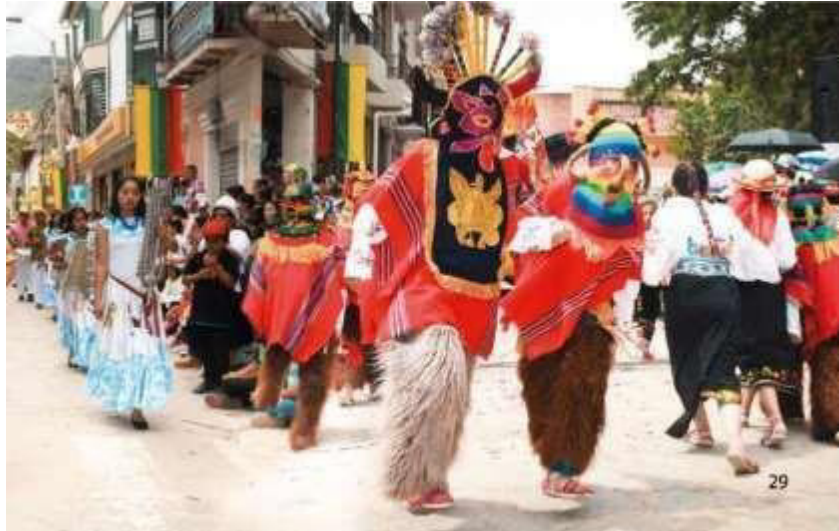
(Paute A. d., Alcaldía de Paute, 2020)

Además, la gincana destinada a los niños de la catequesis sigue siendo una opción que no se deja de lado. Asimismo, las vísperas se celebran con la inclusión de fuegos pirotécnicos, como cuetes y vacas locas, que iluminan el cielo oscuro con estallidos de luces de colores.