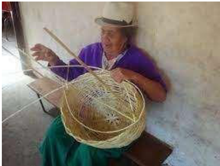
(Paute A. , 2023)

La creatividad de los artesanos en Paute se refleja en la utilización de diversos materiales como cartón, carrizo y piedrillas, proporcionados por la naturaleza misma. Esta muestra de iniciativa demuestra que el cantón cuenta con personas emprendedoras en el mercado artesanal.