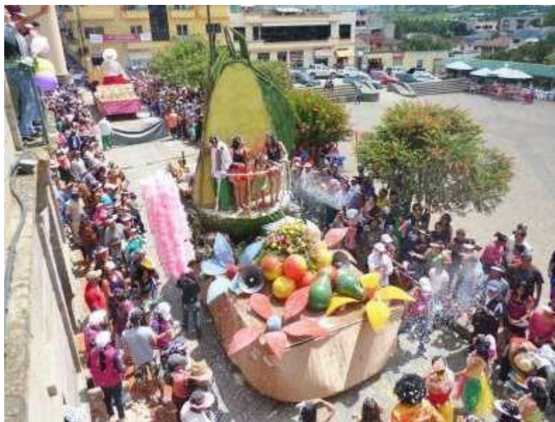
(Paute A. , AME, 2022)

En el cantón Paute, personas de todas las edades, desde los más pequeños hasta los mayores, así como aquellos que disfrutan de una auténtica "fiesta de carnaval", acuden en masa para vivir momentos extraordinarios, colmados de alegría, creatividad, música y mucho más, en compañía de sus seres queridos.