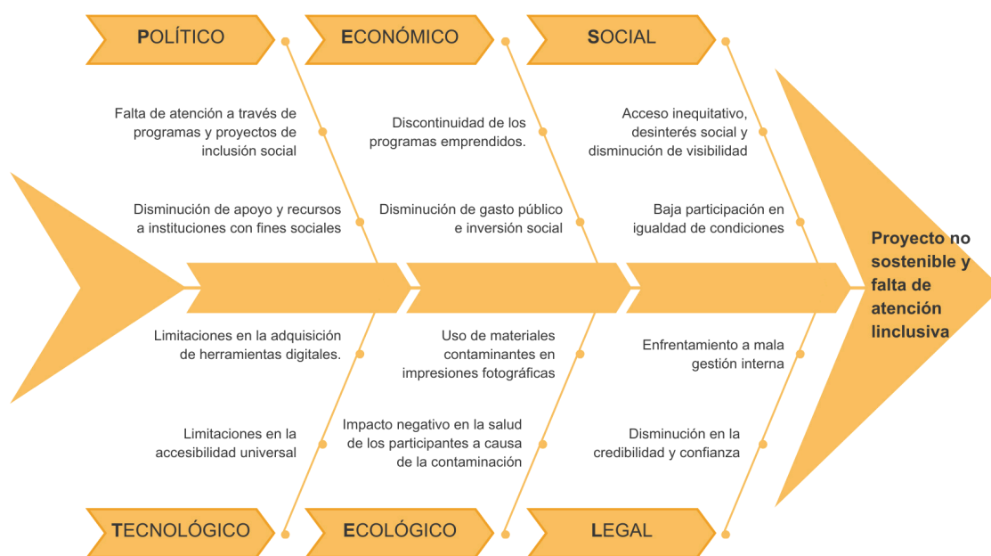
Gráfico 1. Diagrama de Ishikawa

Lo expuesto, no solo evidencia la discriminación política, también la social a la que este grupo poblacional puede estar expuesto, con bajos niveles de accesos y oportunidades que, todavía es latente la discriminación.