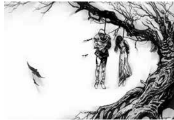
Camino de los ahorcados

La lepra era antes un mal incurable además de contagioso y por este motivo eran perseguidos y reducidos a reclusión en el pabellón del Hospital conocido con el nombre de Aislado todos los enfermos que padecían de ese