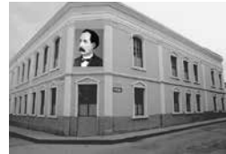
Escuela Miguel Riofrío

La Escuela Miguel Riofrío es la más antigua de la ciudad de Loja. Nace al fervor de la Revolución liberal un 5 de junio de 1985; institución que lleva el nombre de un insigne periodista, abogado, político