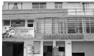
Instituto Los Andes.

Es una institución de carácter privado, patrocinado por la Fundación AndeSur, creado el 26 de enero del 1995. En sus inicios el Instituto Tecnológico Superior Los Andes estuvo dedicado a la