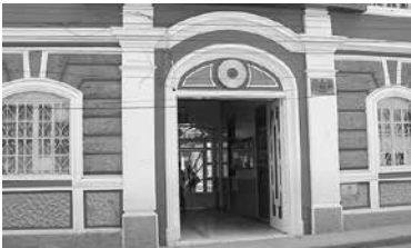
Colegio Santa Mariana de Jesús.

De conformidad con la nueva normativa tenemos la Unidad Educativa Particular Santa Mariana de Jesús, que se ubica en la parroquia El Sagrario, en el centro de la ciudad de Loja.