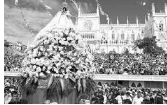
Romería de la Virgen del Cisne

La ciudad de Loja se encuentra ubicada en la región sur del Ecuador, en la cual la actividad turística se ha ido reafirmando de a poco y ha cobrado gran importancia durante los últimos años. El turismo en la ciudad de Loja constituye una de las entradas económicas más importantes, el entorno es agradable, seguro y pintoresco, lo que brinda al visitante la oportunidad de disfrutar de manera atractiva y versátil todo su esplendor.