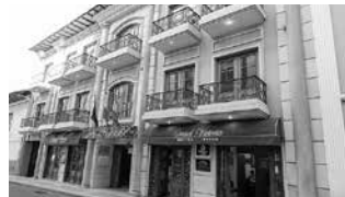
Hotel Gran Victoria de Loja

Como cuatro estrellas fueron clasificados: el Hotel Libertador, Ramses, Howard Johnson, Alma Gemela Hostal; y, como cinco estrellas el Gran Victoria Hotel. En el presente hay muchos otros hoteles y el Howard Johnson pasó a llamarse Hotel Sonesta, cinco estrellas.