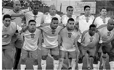
Equipo de LDU Loja, serie A

El miércoles 2 de diciembre de 2015 perdió 2-1 ante el Barcelona en el estadio Los Chirijos de Milagro y se confirma el paso a la Serie B del fútbol ecuatoriano por segunda ocasión en 10 años. Los fracasos deportivos y la mala administración económica por parte de la dirigencia determinaron en el 2019 el descenso a la segunda categoría.