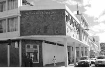
Casa de la Cultura Núcleo de Loja