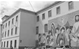
Instituto Daniel Alvarez B.