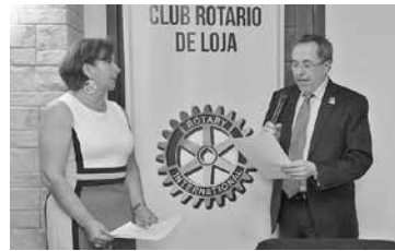
Club Rotario de Loja, 2009

El Club Rotario de Loja durante su trayectoria ha ejecutado varios proyectos de apoyo a las comunidades más necesitadas, con fondos propios y también gracias a donaciones de clubes rotarios de países