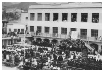
La Salle Loja, 1907

Cuenta la historia que García Moreno delegó oficialmente al Hermano Yon José de La Salle, para que busque la convivencia de alguna posible fundación en las Provincias, y le da plenos poderes para que escogiera locales, trace planos y haga listas de todo lo necesario. A mitad de noviembre de 1870, el Hermano Yon José, arriba a Loja y se entrevista con sus entusiastas y comprensivas autoridades.