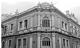
Vieja casona de la UNL, 1960