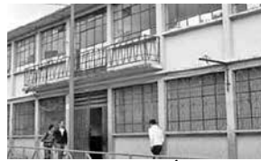
Escuela Eliseo Álvarez

La Escuela Fiscal de Niñas Eliseo Álvarez se ubica en la ciudad de Loja, en la parte sur, en la calle Bolívar Nro. 14-71 entre Lourdes y Catacocha, en la parroquia de San Sebastián. En ella se educaron las niñas de familias de escasos recursos económicos. Obedece su nombre al Dr. Eliseo Álvarez que legó el inmueble para su funcionamiento en el año 1936.