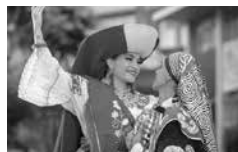
Grupo de danza

La UTPL, en el afán de promover la cultura de Loja, ha creado varios grupos de arte, tanto de música como de danza. Entre los grupos de música tenemos: Antaru, Camerata “Arkos”, Coro universitario, grupo de música folklórica “Ñanyúrak”, grupo Saucedales. Entre los grupos de danza tenemos: grupo de baile moderno, grupo de danza folklórica “Jahua-Ñan” y la compañía de teatro UTPL.