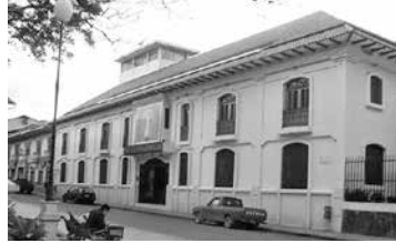
Colegio La Inmaculada

Las Hijas de la Caridad que mantenían la Escuela primaria La Inmaculada en la ciudad de Loja, ofrecían también educación secundaria con el Colegio La Inmaculada, en el mismo establecimiento educativo