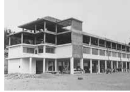
La Salle, foto de 1950.