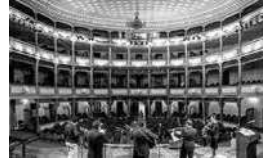
Interior del Teatro Bolívar

Cabe recalcar que el Teatro Universitario se consolidó y organizó por medio de la Asociación Nacional de Teatro Universitario y Politécnica del Ecuador, ANTUPE, desde 1993. Este colectivo pudo