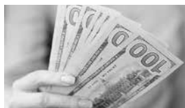
Envío de remesas del exterior

Un factor negativo es el hecho de que la población que recibe este capital no está en condiciones de reproducirlo con proyectos autosustentables. El informe reveló que también existen familias, aunque no especificó el porcentaje, que no reciben ningún dinero, sino que se encuentran en un proceso de ruptura. Los resultados de este estudio se obtuvieron a base de la tabulación del 60% de las encuestas.