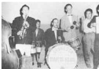
Los Diablos Rojos