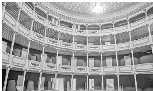
Teatro remodelado en 1980

El teatro Bolívar está considerado como uno de los principales epicentros para la presentación de las grandes obras que se desarrollan en la vida cultural de Loja.