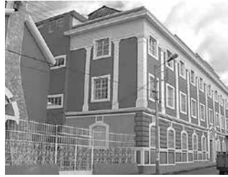
Escuela Santa Mariana de Jesús.

Este instituto nació en Riobamba el 14 de abril de 1873. Fue fundado por la Beata Mercedes de Jesús Molina y Ayala, bajo el Patrocinio de Santa Mariana de Jesús. Fue un Instituto aprobado por el Papa Pío X, el 29 de enero de 1906.