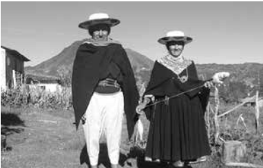
Pareja de saraguros

En la provincia de Loja, hay poca población indígena solo en la parroquia San Lucas del Cantón Loja y en varias parroquias del cantón Saraguro. Los indígenas son conocidos con el nombre de “Saraguros”.