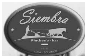
Siembra Pincheria Bar

Según datos del Ministerio de Turismo está: Unicornio Restaurante (segunda categoría), Bar La Siembra (tercera) -este tuvo gran acogida, ubicado en el sector de la pileta, contaba con música en vivo con su propietario