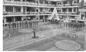
Colegio La Porciúncula

El colegio junto con su escuela conforman hoy, por regulaciones del Ministerio de Educación del Ecuador, la Unidad Educativa Particular La Porciúncula. Cada año celebran la fundación del establecimiento con casas abiertas, en las que sus alumnas exhiben llamativos proyectos trabajados en las aulas bajo la coordinación de sus maestros.