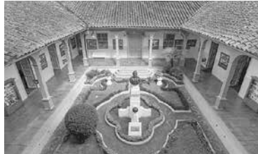
Primer patio del edificio antiguo

El edificio antiguo del colegio Bernardo Valdivieso en donde estudié yo y las generaciones anteriores se ubicaba en la calle Bernardo Valdivieso, entre Rocafuerte y Miguel Riofrío; pero en el año 1964