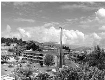
Universidad Técnica Particular de Loja, Ecuador, Sudamérica. Sede Matriz. Vista Panorámica.

En 1976 la UTPL marcó un hito en Latinoamérica al poner en marcha, por primera vez, la modalidad de estudios a distancia con la carrera de Ciencias de la Educación, haciendo posible el acceso a personas de todo el país que antes no podían cumplir sus sueños de obtener su título de tercer nivel debido a su situación geográfica.