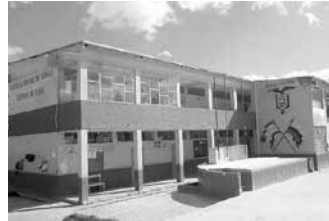
Escuela Ciudad de Loja