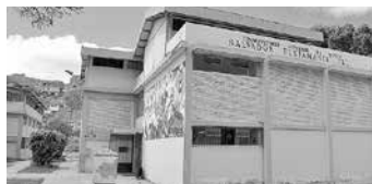
Conservatorio Salvador Bustamante Celi

Se proveyó al Conservatorio de docentes calificados, buscando maestros en todas las especialidades instrumentales, así como instrumentos musicales