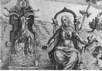
Las brujas de Zamora Huaico

Así, en una de esas casas situada en una calle principal, pero hacia el sur de la ciudad, vivía una dama solterona a que pasaba igual que los demás de su oficio dormitando las tardes tras el mostrador de su almacén. Las comodidades de que gozaba y la vida sedentaria que llevaba, no pudieron por menos que volverla sumamente voluminosa y la grasa terminó borrando sus facciones otrora regulares y bonitas.