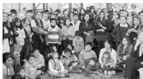
Grupo de la Fundación Espacios

La Fundación Espacios está dedicada al fomento de las comunidades y a resolver problemas de la violencia intrafamiliar. Inició sus