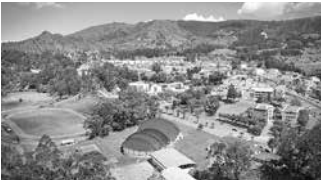
Campus universitario "La Argelia", 1990.

El 23 de febrero de 1960 se dio inicio a la Facultad de Filosofía, Letras y Ciencias de la Educación que contó con las carreras de Filosofía y Letras, Psicología, Educación Parvularia, Licenciatura en las especialidades de Físico-Matemáticas y Químico-Biológicas. Al inicio se trajo un grupo de profesores de la Universidad Central, la mayoría de los cuales se quedaron en Loja.