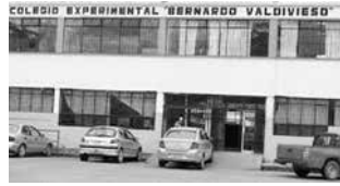
Nuevo edificio del Colegio Experimental Bernardo Valdivieso, 1996.

“El 11 de diciembre de 1964. Por acuerdo Ministerial 4066, el Colegio Nocturno Leones de Loja fue anexado al Bernardo Valdivieso en calidad de sección nocturna. En 1967 mediante Decreto Nro. 098 expedido por la Asamblea Nacional Constituyente el Bernardo Valdivieso fue elevado a la categoría de Colegio Experimental. El 24 de Abril de 1996 por acuerdo Nro. 002 la Dirección Provincial de Educación de Loja confiere al Colegio la categoría de Unidad Educativa Experimental. En 1999 el colegio contó con 3000 estudiantes divididos en 3 secciones matutina, vespertina y nocturna, con un personal docente y administrativo comprendido en 200 profesores y 50 empleados” 1 .