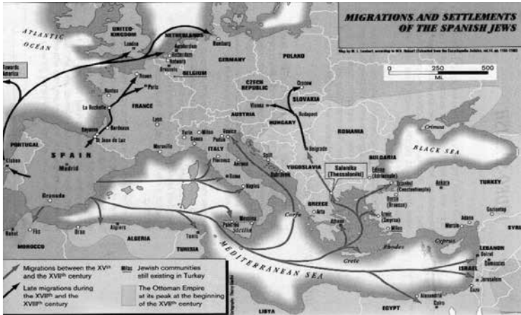
Territorios europeos de habla sefardi

= peste; Trolas = nombre de un juego, bolas; Trocar = cambiar, permutar; Techar = cubrir un edificio con el techo; Tramojo = instrumento que se coloca a los animales en el cuello para que no atraviesen las cercas; Usté = usted; Vide = vi; Vigüela = guitarra; Verdá = verdad; Verija = ingre femenina; Voluntá = voluntad; Yora = ahora; Yerba = hierba; Zarco = de ojos azules; Zarcillo = pendiente, arete; y, Zambo = negro.