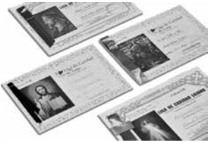
Ligas de Caridad