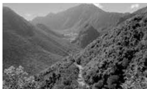
Parque Nacional Puhulahuá

El área protegida del Parque Nacional Galápagos se creó el 4 de julio de 1959 y constituye el Primer Parque Nacional Ecuatoriano, formando parte del Patrimonio Natural del Estado. Desde entonces hasta la fecha, las políticas y estrategias de conservación han ido ganando importancia.