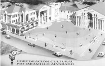
Plaza de la Cultura

En el año 2003 se realizó trabajos de restauración en el primer patio del Colegio Bernardo Valdivieso y en el patio central de la Casona Universitaria. En este mismo año se comienza con la implementación del Museo de Música, el mismo que fue inaugurado el 6 de septiembre del 2004. El Museo de Música constituyó el primer componente implementado y se ubicó en el Antiguo Colegio Bernardo Valdivieso, en donde se encuentra información y objetos pertenecientes a los grandes músicos y compositores lojanos.