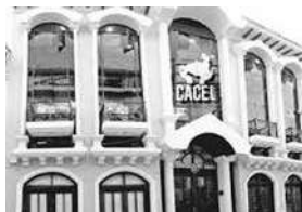
Edificio matriz de CACEL