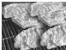
Parrillada de Chalo

Finalmente, como de cuarta categoría fueron clasificados: La Y Restaurante, A lo mero mero, Marios Restaurante, Candy Cafetería, Ruskina Fruques Restaurante y, Manantial Restaurante.