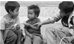
Hijos de migrantes

Otro indicador que revela el nivel de alejamiento entre emigrantes y familiares viene dado por la frecuencia de envío de remesas. En efecto, esta última determina el nivel de compromiso entre el emigrante y su familia, y por tanto, el funcionamiento y cohesión de la familia transnacional: un 8% no envía remesas, el 54% de los emigrantes lojanos envía remesas al menos una vez por mes, el 18% lo hace sin periodicidad fija, y un 3% lo hace menos de una vez al mes.