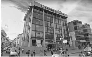
Edificio del Banco de Loja

Por iniciativa de prestantes ciudadanos de Loja y luego de la aplicación de la reforma agraria en esta provincia, el 14 de julio de 1967 se constituyó el Banco de Loja S.A. con el objetivo de satisfacer las necesidades financieras de la población de las provincias de Loja y Zamora Chinchipe.