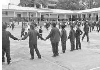
Escuela José Ángel Palacios