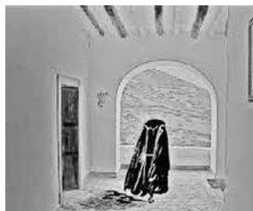
El cura sin cabeza

Pero hubo la excepción y ella estuvo compuesta por un pequeño grupo de jóvenes que habían bebido más de la cuenta y se sintieron muy a tono como para encontrarse e incluso desafiar al temido “Cura sin cabeza”. Se