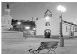
Iglesia del Pedestal

La Iglesia del Pedestal, fue construida en el año de 1927 con la colaboración de los hermanos misioneros redentoristas. Su estructura es de piedra, posee cimentación, columnas y pilares de tapia, las vigas, techos, de madera. Posee fachada recta con características de la arquitectura tradicional, la portada frontal remata en un arco de medio punto con enmarcamiento, la fachada remata en cornisa y en un campanario tipo espadaña, las ventanas tienen dintel de arco de medio punto. La edificación tiene una nave central, y varios ambientes para distintas actividades componentes de la iglesia, también existen espacios para actividades de desarrollo y bienestar de sus feligreses, por lo cual se puede decir que funcionalmente presta un buen servicio a la comunidad. El remate en las fachadas laterales y alero con canecillos de madera.