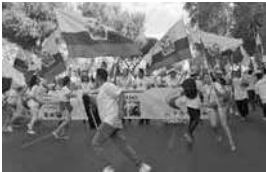
Migración a España

llevar uniforme e ingresar por la puerta de servicio. Especialmente las migrantes tenían experiencias negativas de las patronas: “Todas son así, jodidísimas, de verdad, todas. Agravios para arriba y para abajo; no se libran de ellos ni los hijos ni el marido” (Carrión, 2012, p. 187).