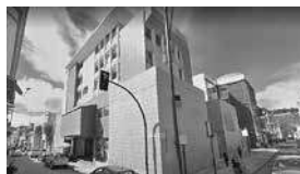
Edificio del Banco Central en Loja.