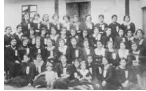
Coro Santa Cecilia