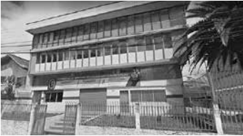
Instituto Juan Montalvo

Los miembros promotores del Instituto fueron los socios de la Cooperativa de Servicios Educativos Juan Montalvo que fue creada mediante Acuerdo Ministerial Nro. 01219 de fecha 14 de mayo de 1999, fecha desde la cual viene ofreciendo los niveles de educación primaria y secundaria en su local propio ubicado en la Avenida Emiliano Ortega 13-75 y Lourdes, en esta ciudad de Loja.