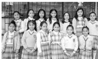
Niñas de La Porciúncula

Partimos aclarando que en el siglo XX teníamos escuelas y colegios. Solo en la segunda década del siglo XXI el Ministerio de Educación cambió la estructura por unidades educativas que debían dar formación básica (primaria) y Bachillerato (secundaria), por eso hoy se habla de unidades educativas. Anteriormente, todos los colegios religiosos tenían la sección primaria y la sección secundaria. Asimismo, no hubo escuelas ni colegios mixtos, eran de hombres o mujeres.