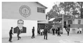
Escuela José Alejandrino Velasco