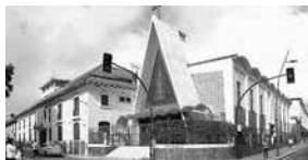
Unidad Educativa La Inmaculada