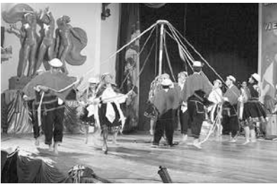
Grupo de danza

Para incentivar la actividad cultural de la UNL (en ese tiempo la función se llamaba de difusión cultural) se estableció el Instituto de Cultura y Arte (ICA) que trajo en su momento alegría y esperanza para muchos cultores que por los años 70 estaban interesados en cultivar sus talentos, en áreas como: música, teatro, artes plásticas, danza, canción social, entre otras. Para entonces funcionaba en un local ubicado en la Plazoleta Primero de Mayo, hoy conocida como Parque de las Flores.