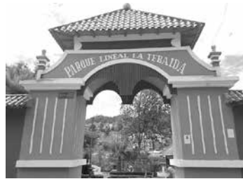
Parque Lineal La Tebaida