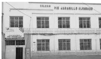
Colegio Pío Jaramillo