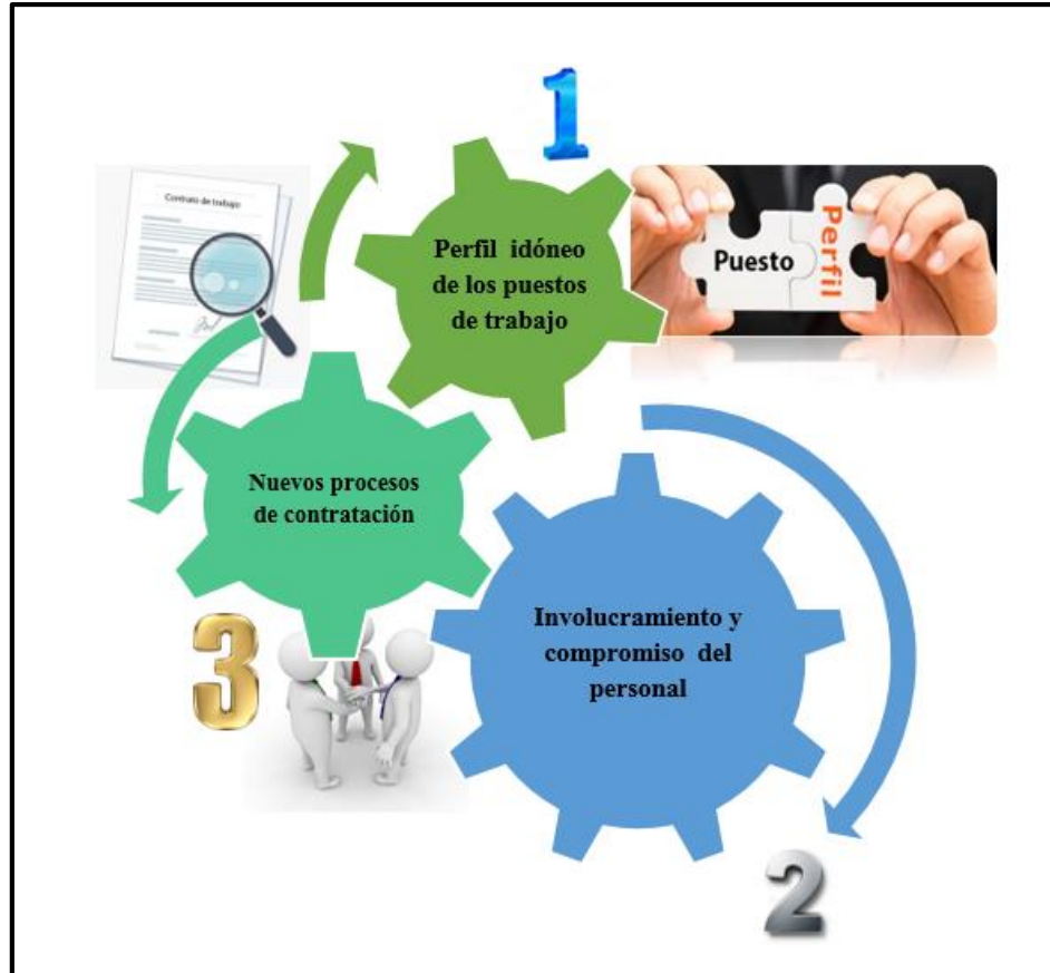
Ilustración 3. Pilares para la retención del talento humano. Elaboración: Nolazco (2019).

Pilar 1: Diseñar el perfil de los puestos de trabajo.