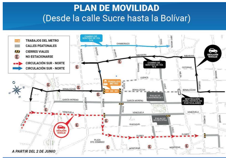
Ilustración #1 Se describe el plan de movilidad para el Centro Histórico de Quito, a propósito de un cierre vial por la construcción del Metro de Quito. En la imagen se muestran con un color gris las calles peatonizadas del sector.

la calle García Moreno (107.120,00 dólares), buscando “que el paseo peatonal luzca atractivo para los visitantes del casco colonial”, materializando la ideología, estética y actores patrimoniales que pueden hacer uso del espacio.