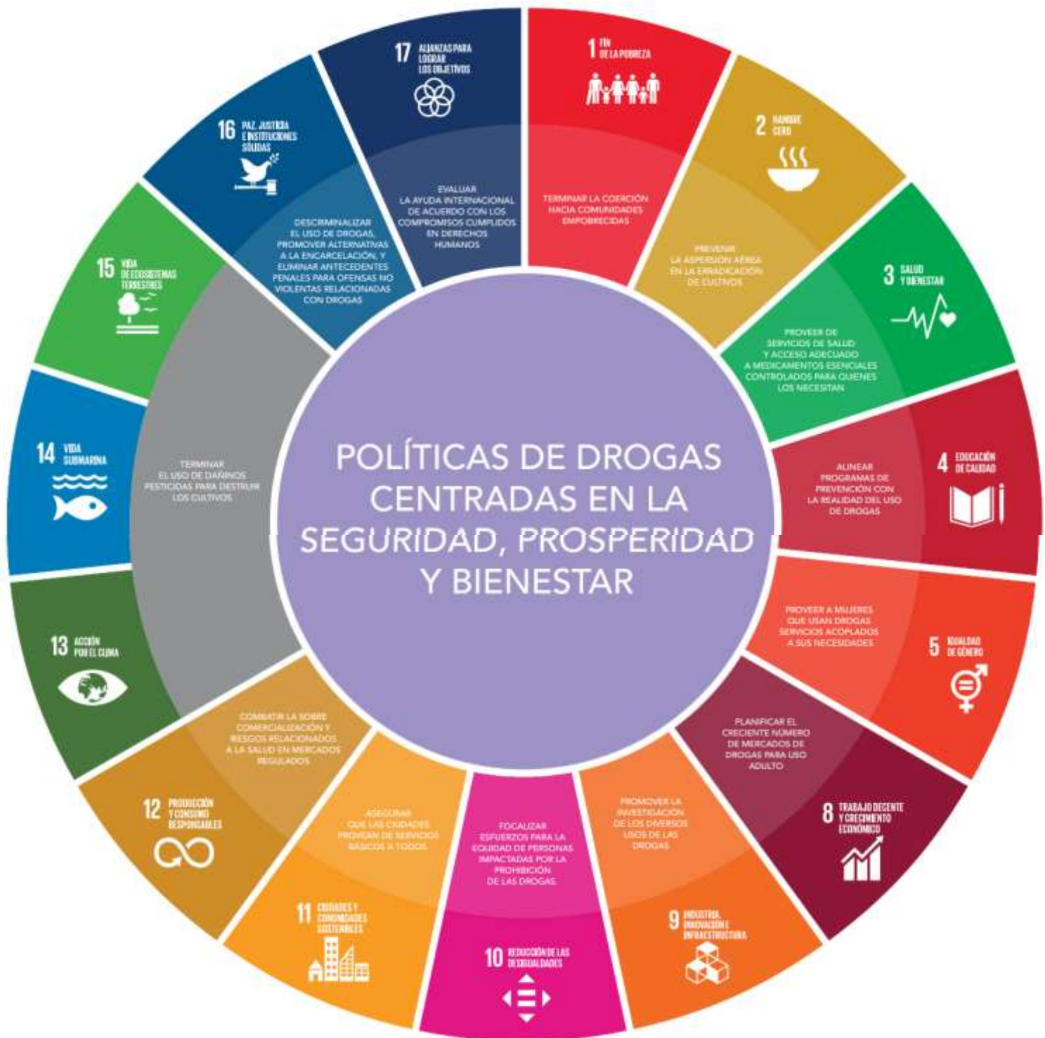
Figura 2.- Reforma a la Política de Drogas en la Agenda de Desarrollo Sostenible