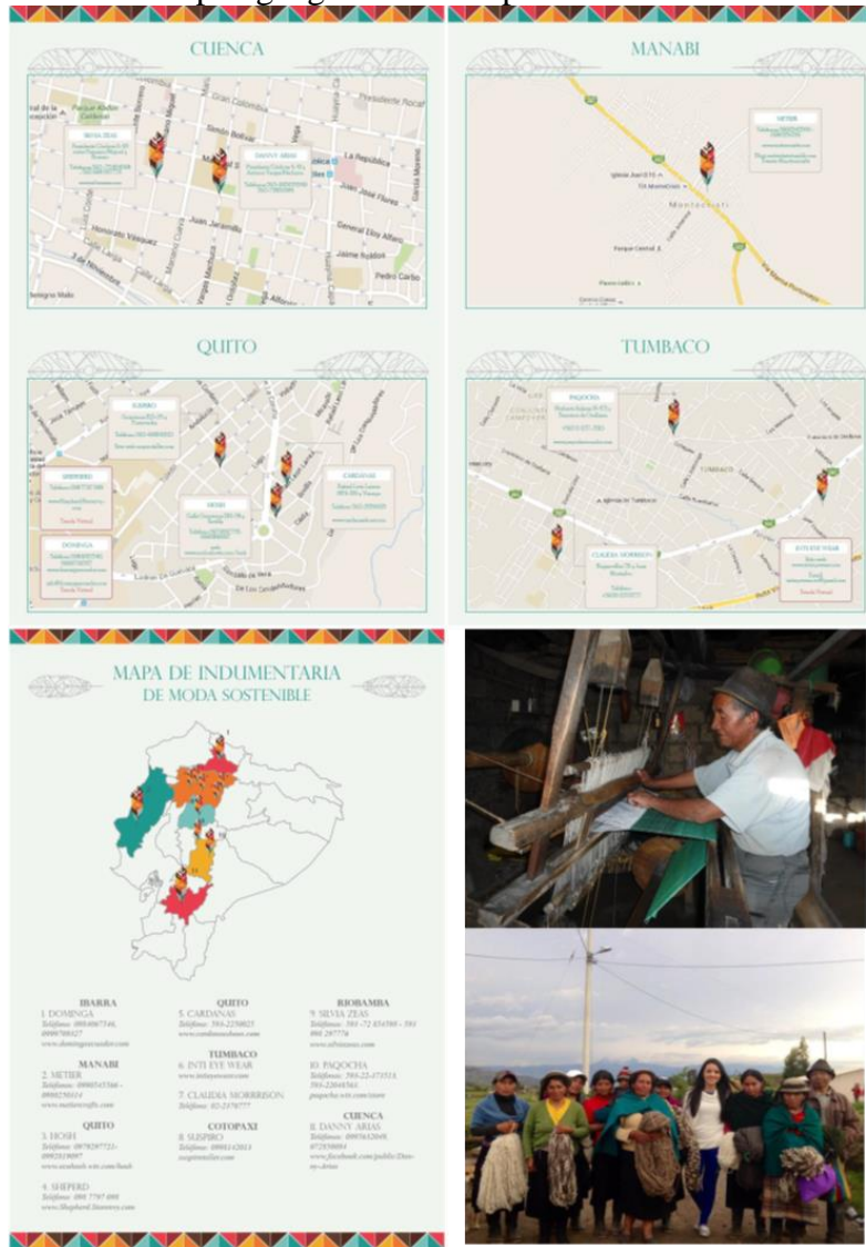
Tabla 1: Mapeo geográfico de empresas de moda sostenible