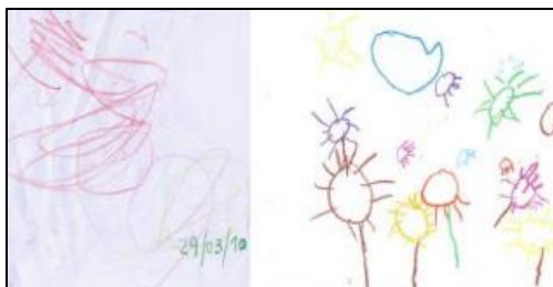
Figura 1. Fase Pre escritora

Fuente: Triones y Gallardo (2017). Psicología del desarrollo: La evolución del gesto figura y el desarrollo de la grafomotricidad