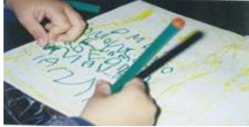
Figura 2. Fase pre caligráfica