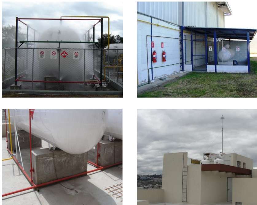
Figura 4: a) Sistema de enfriamiento sobre tanque b) Restricción al paso de extraños c) Puesta a tierra d) Pararrayos que protege el área de almacenamiento.