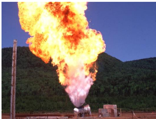
Figura 1. BLEVE en tanque de GLP (Nardini & Nolasco, 2014)

El peligro que conlleva la BLEVE está relacionado con la destrucción total que ocasiona en todo lo que encuentra a su paso (Shariff, Wahab, & Rusli, 2016).