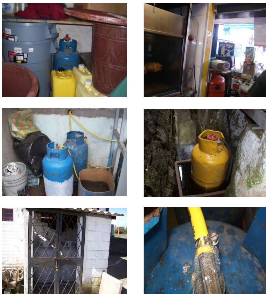
Figura 3: Recipientes de GLP a) cerca de fuentes de ignición b) rodeado de elementos combustibles c) con falta de vaporización d) ubicado en tina con agua caliente e) sin señalización ni elementos de prevención f) con accesorios en mal estado.

Todos los accesorios tienen una determinada vida útil, la cual no siempre es respetada por los usuarios que pretenden extenderla lo más posible. En la Figura 3f se puede apreciar la fuga del combustible a través de la manguera de conexión al cilindro.