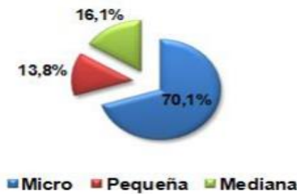
Ilustración 1: Distribución Microempresas