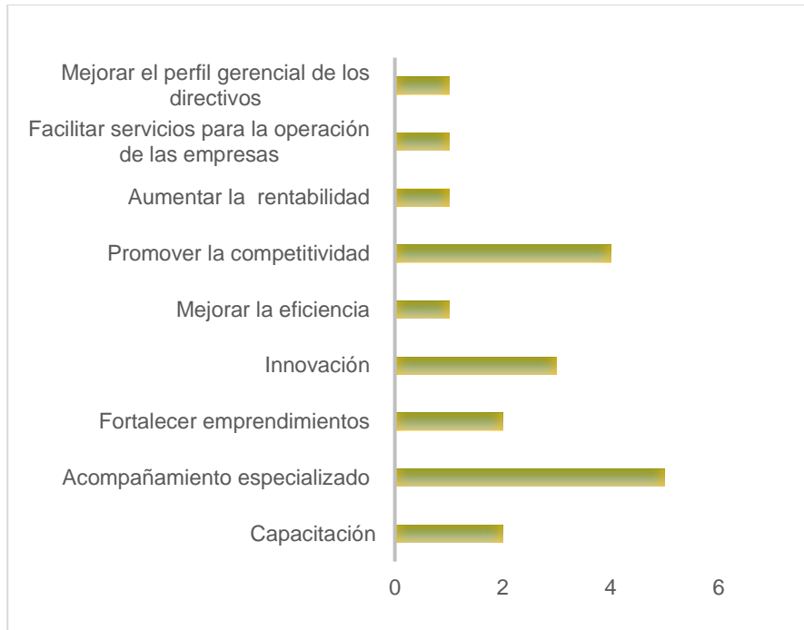
Gráfico 1: ¿Cuáles considera usted deberían de ser los objetivos primordiales de estas empresas?

De acuerdo con lo expresado por los expertos, existen de manera generalizada 9 áreas de en las que deben fundamentarse los objetivos de una incubadora y/o aceleradora, y resaltan sobre ellas los servicios de promover la competitividad y el acompañamiento especializado.