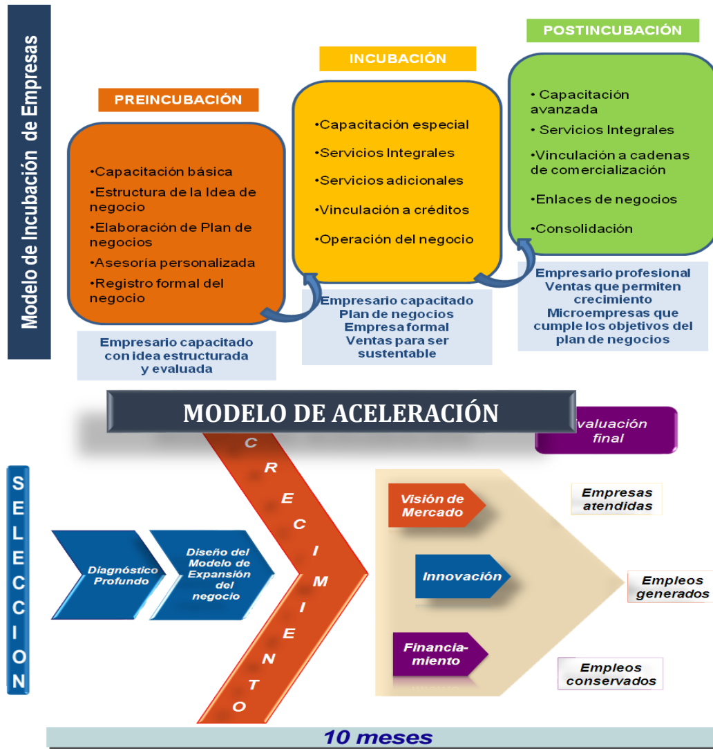
Ilustración 2. Modelo de Incubación de Empresas