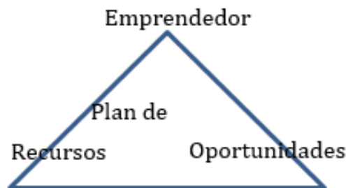
Gráfico No. 2. Factores del éxito empresarial Fuente: (Timmons, 1999)

La ventana de las oportunidades es un paso fundamental que debe situar al individuo en la búsqueda generar un plan de negocios que evidencia la oportunidad acompañada de los recursos disponibles para su ejecución, a cargo y bajo dirección del emprendedor en todo momento, tal como se muestra a continuación: