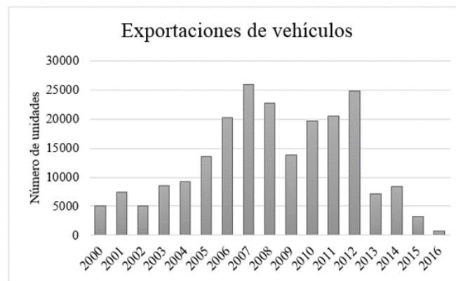
Figura 2. Exportación nacional de vehículos

Como se puede observar en la figura 2, las exportaciones del sector automotor en el 2016 fueron de 716 unidades, siendo el año más bajo del período 2000 – 2016; esta reducción se debe principalmente a la resolución 50 del Comité de Comercio Exterior emitida el 20 de diciembre del 2015, que entró en vigencia el 1 de enero del 2016, en donde se estableció una cuota global para las importaciones de vehículos terminados y para ensamblaje en el país.