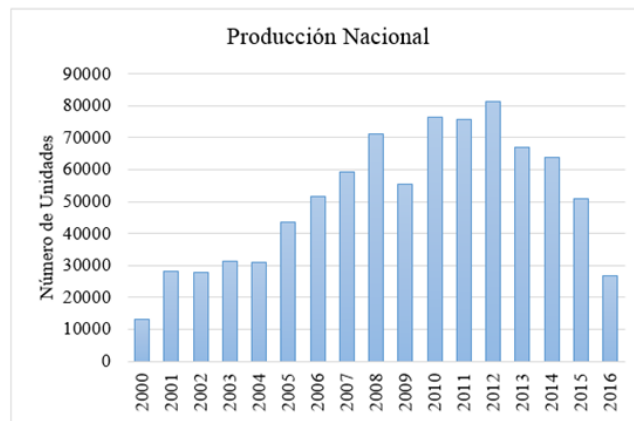
Figura 1. Producción nacional de vehículos

Según cifras de la Asociación de Empresas Automotrices del Ecuador (AEADE), las empresas ensambladoras produjeron 26.786 vehículos en el año 2016, como se puede ver en la figura 1.