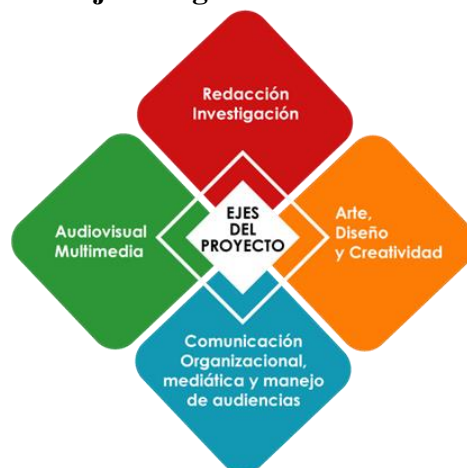
Gráfica 1.- Ejes integrados en el PIS de la UIDE